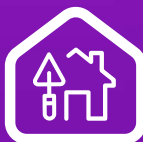
CRÉDITO AMPLIACIÓN REPARACIÓN O MEJORAMIENTO