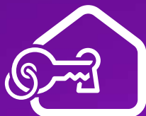
CRÉDITO TRADICIONAL EN PESOS