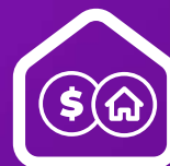
CRÉDITO REDEDUCCIÓN DE PASIVOS