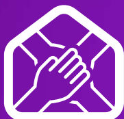
FOVISSTE PARA TODOS